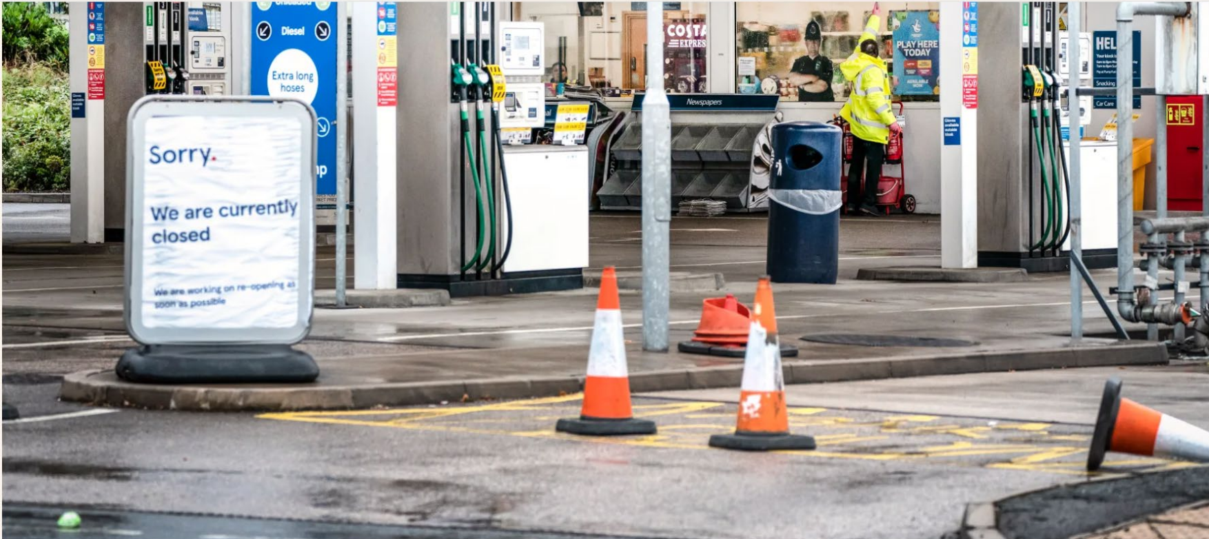
En stängd bensinstation i Manchester på tisdagen.

Slagsmål bryter ut på bensinstationer. En oro över brist på bensin och diesel har orsakat kris i Storbritannien. Nu djupnar sprickorna i landet där armén ska kallas in för att köra tankbilar med drivmedel.